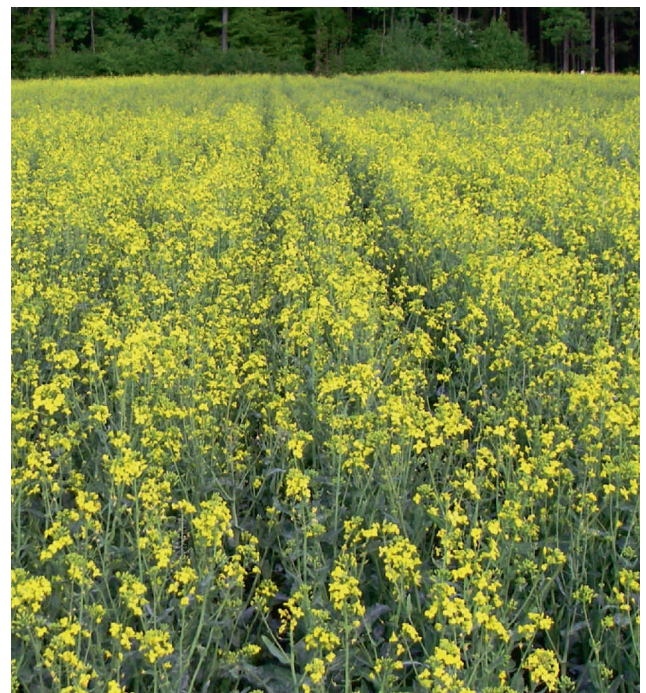
Fig. 4 Einsatz von Tonmineralien gegen den Rapsglanzkäfer im sensiblen Stadium (links) und blühender behandelter Raps (rechts)

Application d'argile minérale contre le mélégièthe du colza pendant le stade sensible (à gauche), colza traitée en floraison (à droite)