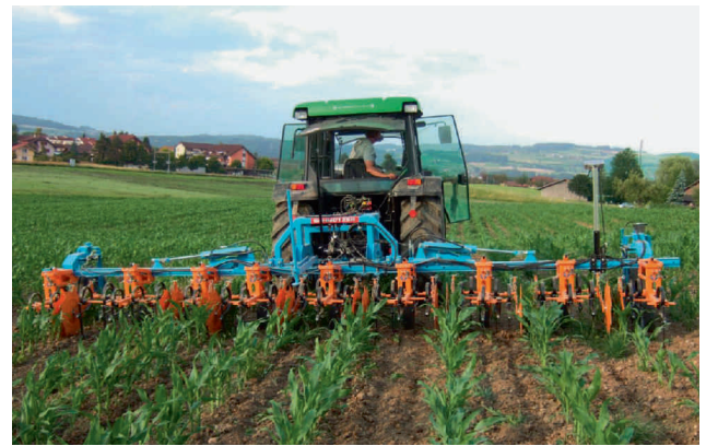
Fig. 3 Die mechanische Unkrautregulierung hat sich weiterentwickelt.

Links: Hackgerät mit manueller Lenkung und rechts: Hackgerät mit Kamerasteuerung